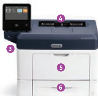
Xerox® VersaLink® B400 printer Print.

2 USB-poorten kunnen worden uitgeschakeld; 3 alleen voor VersaLink B405.