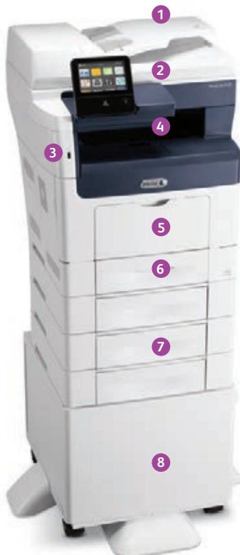
Xerox® VersaLink® B405 multifunctionele printer Print. Kopieer. Scan. Fax. E-mail.